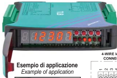
Esempio di applicazione Example of application